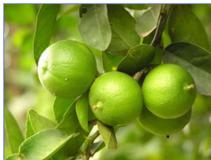
มะนาวไซ้พื้นเมือง

ชื่อวิทยาศาสตร์ Citrus aurantifolia Swingle