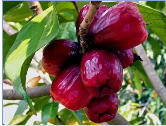
ชมพู่มะเหมี่ยว