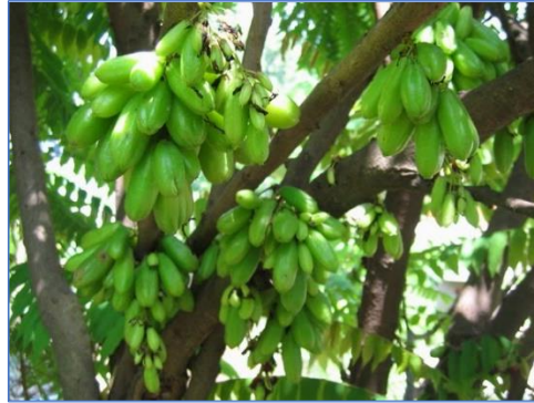
ตะลิงปลิง