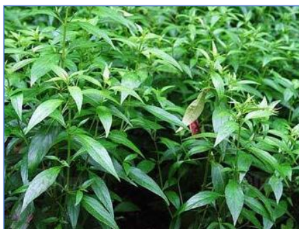
ฟ้าทะลายโจร